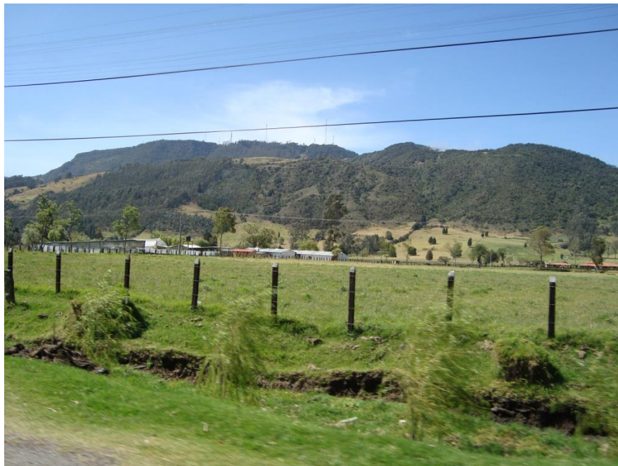
Panorámica del Cerro de Manjui

Manjui: es una lengua en peligro próximo de extinción; hay pocos grupos de indios Manjui y varios de ellos se han mimetizado en comunidades Nivaclé donde, si bien no se identifican con los Nivaclé, están expuestos a un proceso de abandono paulatino de su lengua y de sus