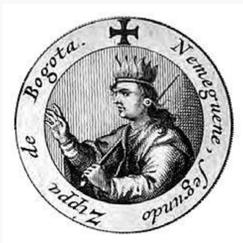
Nemequene representado en un grabado de la Historia General de las Conquistas del Nuevo Reino de Granada (1688), del cronista Lucas Fernández de Piedrahita .