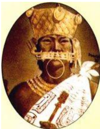
Representación pictórica de Tisquesusa.