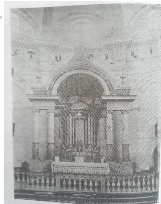
Altar Mayor de la Iglesia de Padres Agustinos, Facatativá (Colombia), 1924.