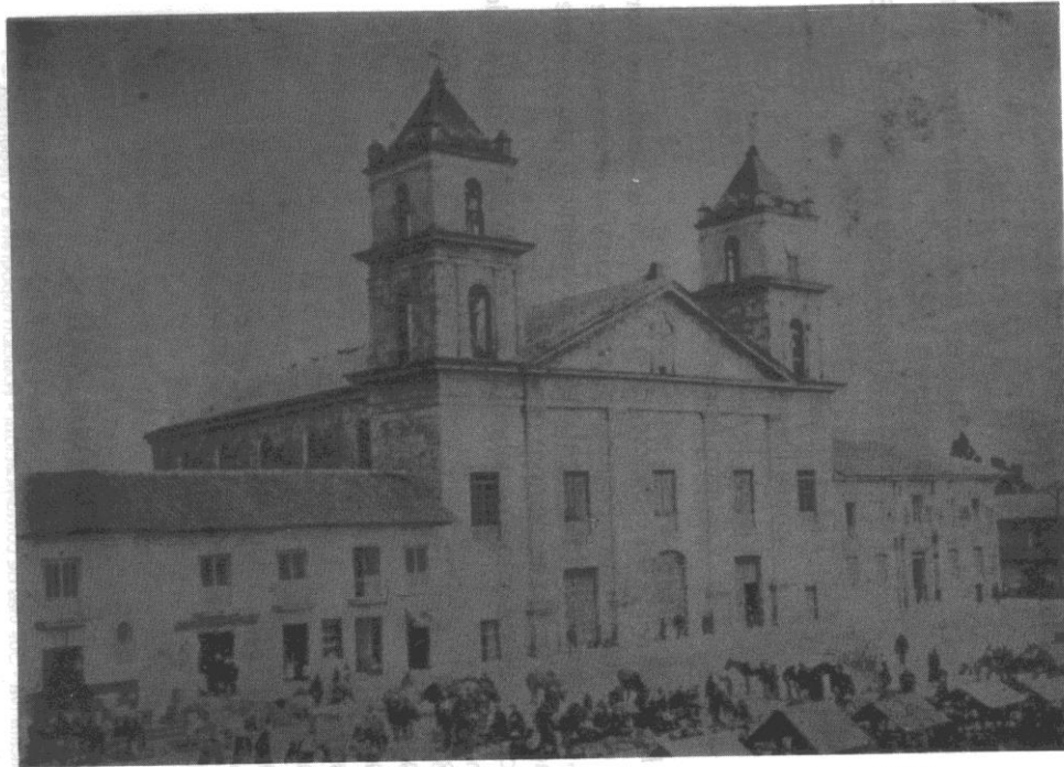
Iglesia Parroquial de Padres Agustinos, Facatativá (Colombia), 1924.