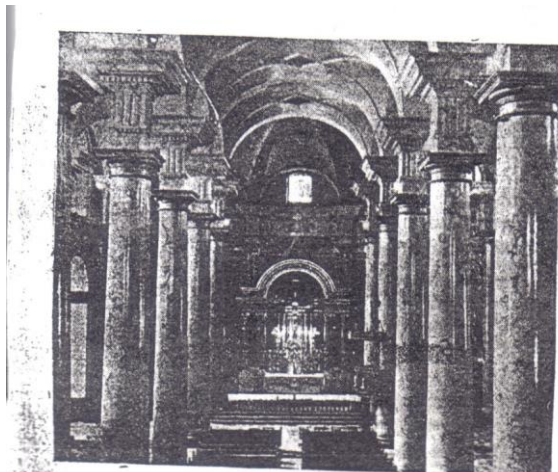
ALTAR MAYOR DEL TEMPLO DE FACATIVIVA