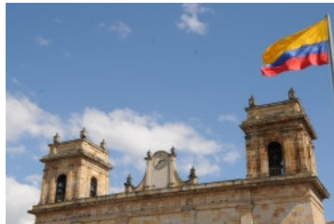
Iglesia Nuestra Señora del Rosario.

Las estadísticas de un municipio son fundamentales para lograr la formulación del plan de desarrollo cuyo análisis descriptivo, Permite una descripción más exacta, Nos obliga a ser claros y exactos en nuestros procesos y procedimientos, en nuestro pensar, luego, nos permite resumir los resultados de manera significativa y cómoda, lo que ayudara a deducir conclusiones generales y pertinentes.