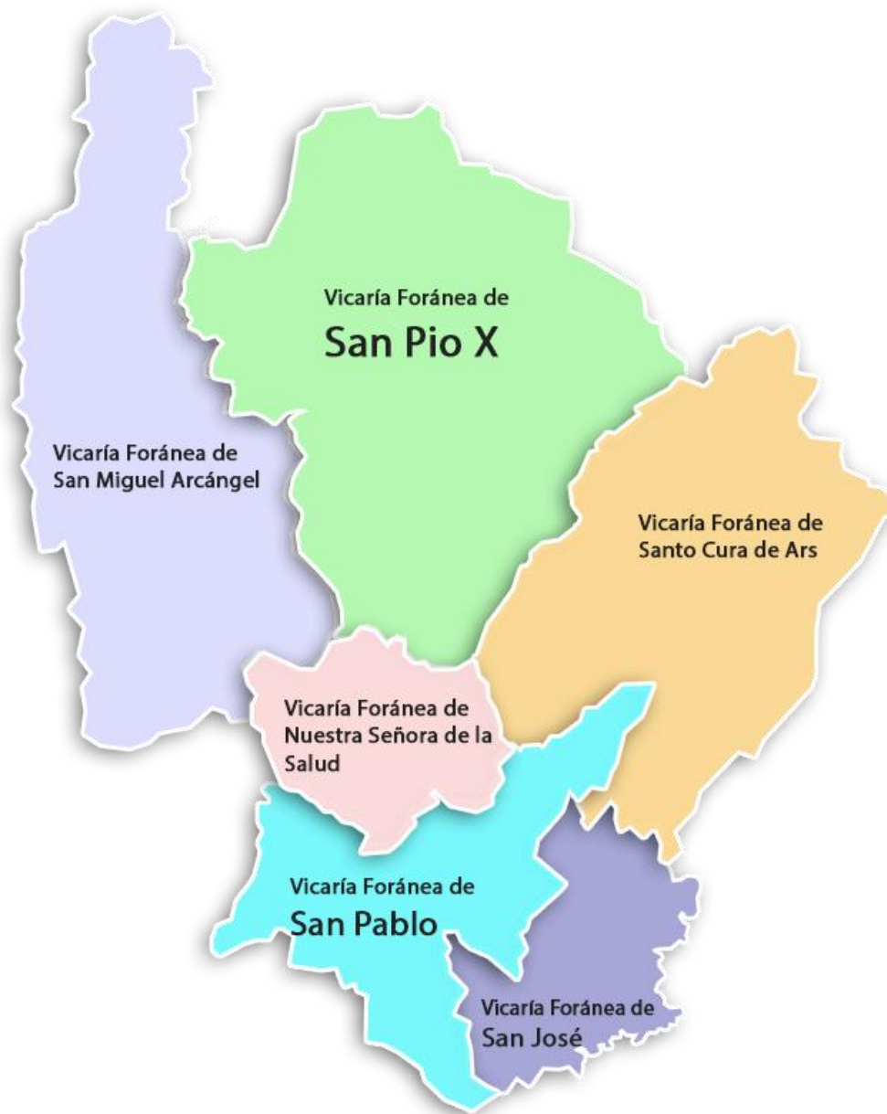
Mapa de la Diócesis de Facatativá